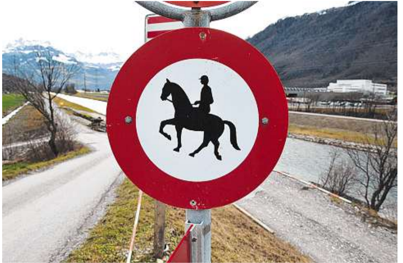
Reitverbot im Fokus: Zwischen Schänis und Ziegelbrücke haben Pferde auf dem Linthdamm keinen Zutritt, sie werden auf die Biltner Seite im Hintergrund verwiesen.

Versuche, das Reitwegenetz zu verbessern, seien im Gang, der im Sommer gegründete Dachverein Reiten und Umwelt Linthgebiet-Glarnerland arbeite daran. «Wir wollen mit der Linthverwaltung besser ins Gespräch kommen», sagt dessen Vorstandsmit-